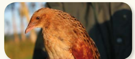
Râle des genêts capturé dans les bandes refuges

Ce suivi a aussi permis de révéler le rôle des bandes refuges comme zone de halte migratoire pour de nombreux