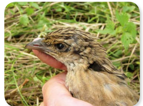
Jeune Râle des genêts au cours des autres suivis.

Dans la plupart des cas, la fauche de ces parcelles en mesures d'urgence a été suivie par les équipes du Conservatoire, qui ont ainsi pu récolter des informations essentielles quant à l'utilité et l'efficacité de ces mesures. En effet, plusieurs poussins âgés de 10 à 20 jours ont pu être observés au sein de trois parcelles placées en mesures d'urgence, alors qu'aucune observation de juvénile n'avait été faite